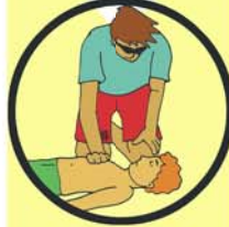
UTILIZAR UN BRAZO O DOS UTILIZAR UN BRAZO OU DOUS SEGÚN CORPULENCIA SEGUNDO CORPULENCIA