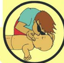
INSUFLACIONES INSUFLACIÓNS BOCA A BOCA-NARIZ BOCA A BOCA-NARIZ