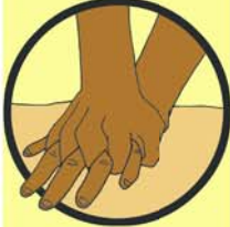
AL MENOS 5 CM POLO MENOS 5 CM FRECUENCIA 100/MIN FRECUENCIA 100/MIN