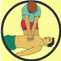
CENTRO DEL PECHO CENTRO DO PEITO LÍNEA INTERMAMILAR LÍNEA INTERMAMILAR