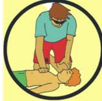
UTILIZAR UN BRAZO O DOS SEGÚN CORPULENCIA UTILIZAR UN BRAZO OU DOUS SEGUNDO CORPULENCIA