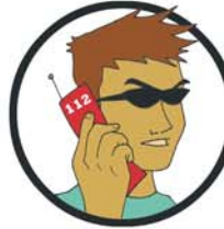
LLAMAR 112 CHAMAR 112