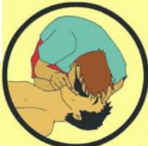
INSUFLACIONES INSUFLACIÓNS BOCA A BOCA BOCA A BOCA