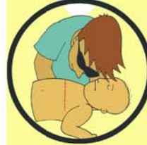
CENTRO DEL PECHO CENTRO DO PEITO LÍNEA INTERMAMILAR LÍNEA INTERMAMILAR