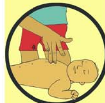
AL MENOS 4 CM POLO MENOS 4 CM FRECUENCIA 100-120/MIN FRECUENCIA 100-120/MIN