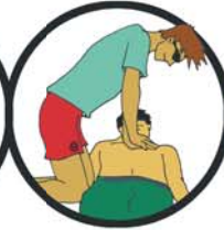
RCP BÁSICA RCP BÁSICA