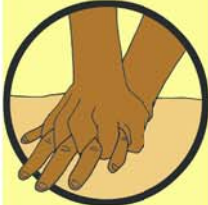
AL MENOS 5 CM POLO MENOS 5 CM FRECUENCIA 100/MIN FRECUENCIA 100/MIN