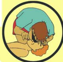
INSUFLACIONES INSUFLACIÓNS BOCA A BOCA BOCA A BOCA