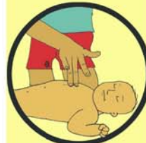
AL MENOS 4 CM POLO MENOS 4 CM FRECUENCIA 100-120/MIN FRECUENCIA 100-120/MIN