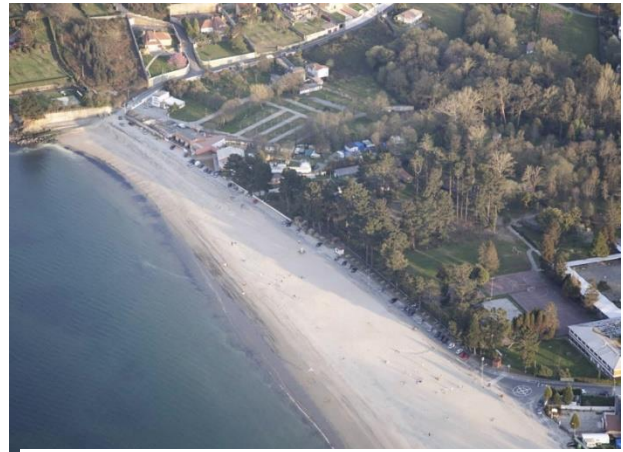
Ilustración 1 vista aérea playa de Gandarío

A continuación se detallan las zonas del área de competición