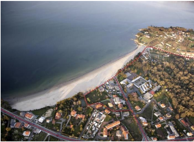
Ilustración 2 vista aérea playa de Gandarío

Se trata de una playa semiurbana con una longitud de 600 metros aproximadamente, resguardada con arena blanca y fina . Ventosa con aguas tranquilas y oleaje moderado.